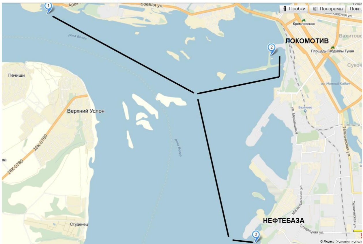
Схема проезда до ЛС "Локомотив" и до Нефтебазы